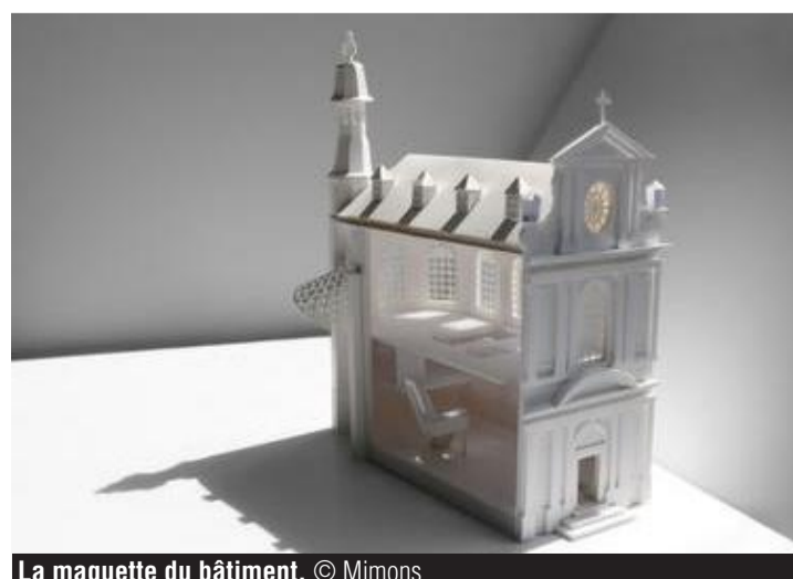
La maquette du bâtiment.

à noter Mumons – Campus des Sciences Humaines – Place du Parc, 24 – 7000 Mons – www.mumons.be